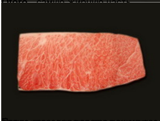
телца, отсортирована и обработана, лойны и саку