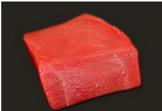
Окляна животом и менее жирную